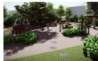
2 Delar av plantering tas bort så stoppas inte rörelsen upp mellan de olika lekställningarna