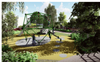
1 Mönster i gummibeläggnigen leder rörelsen genom de olika lektytorna.