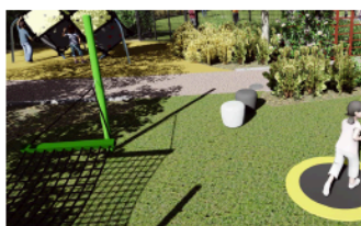
5 Vid studs mattorna finns olika sittelement som hängmattor och plaststubbar.