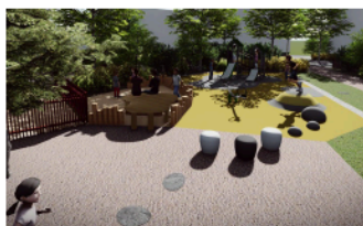
3 Sten i markytan, sittelement och gummikullar leder rörelsen mot nästa lekställning.