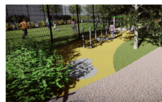
6 Mot motorikbana