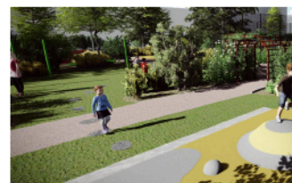
4 Slingan fortsätter mot studs mattorna